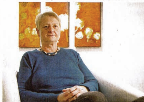
Angelika Krafts Bilder faszinieren durch verschiedene Strukturen.

Durch fortlaufende Korrosion entstehen Bilder, die durch ihre Strukturen und Farbenvielfalt faszinieren. Die Collagen der Künstlerin scheinen zu leben, denn sie sind offen für Veränderungen. Plötzlich sieht ein Augenpaar aus der Tiefe der Patina den Betrachter an. Auf einem, in diesem Jahr fertiggestellten Tripty-