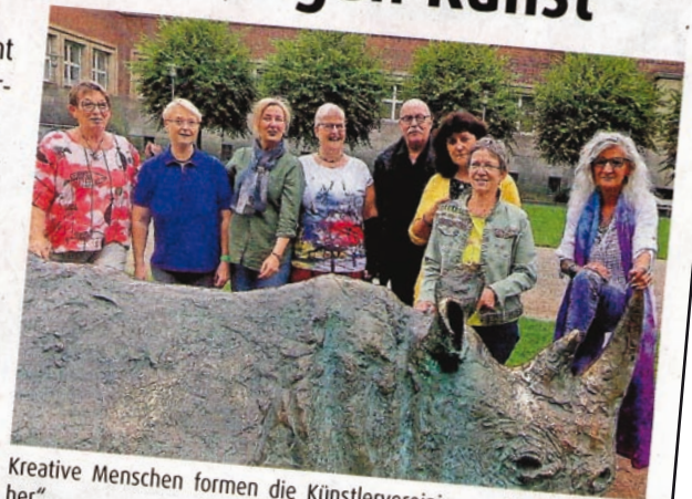
Kreative Menschen formen die Künstlervereinigung „Der Blaue Rather“.

Die Atelier-Galerie-Kraft freut sich, Werke von acht Künstlern der Künstlervereinigung „Der Blaue Rather“ präsentieren zu können.