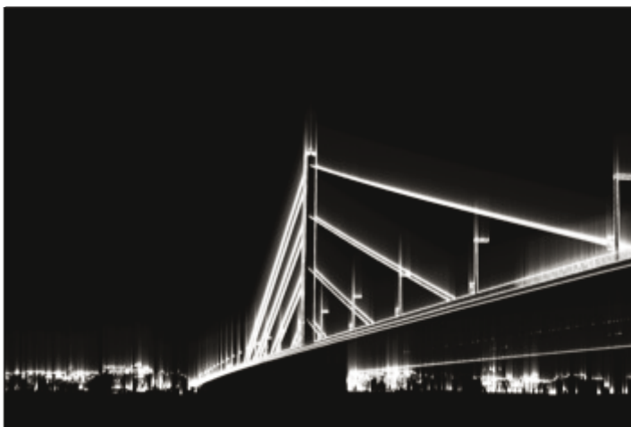
Herbert Kröll FOTOGRAFIE & GRAFIK